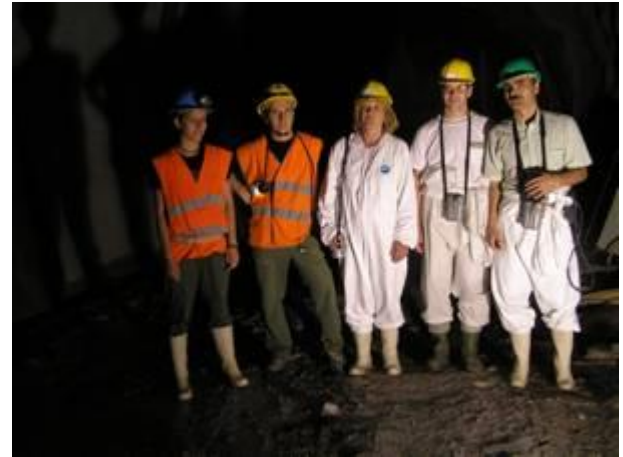
4. ...azért elértük.