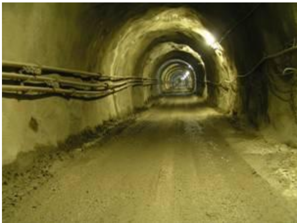
3. Lőtt beton falak. Messze még a vége...