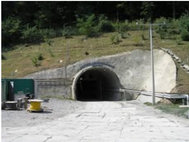
1. Itt indul az alagút.