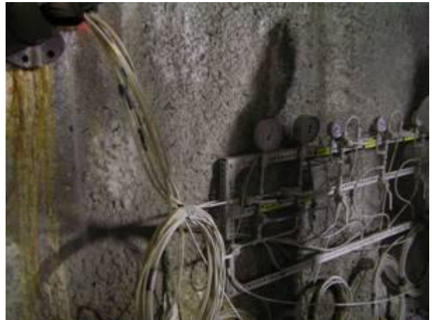
2. Nyomásmérők a falon.